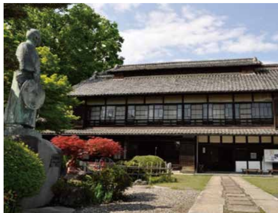
写真1：旧渋沢邸「中の家」