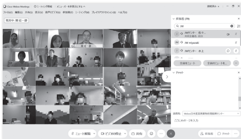
講義終了後の関理事長のご挨拶の様子