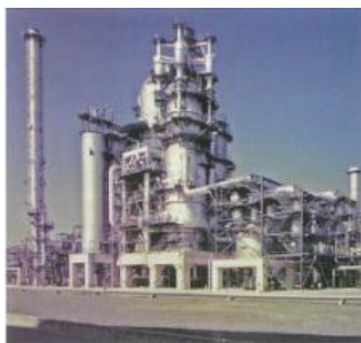
<石油精製所を活用したリサイクル設備>