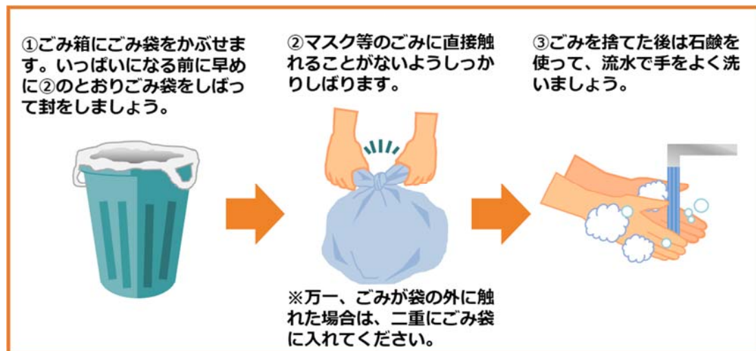
図1 新型コロナウイルス等の感染症の感染者又はその疑いのある方の使用済みマスク等の捨て方(環境省)

また、家庭ごみのうち通常リユース・リサイクルする資源については、市町村によって以下の対策が検討され、実施される場合があることを認識する。