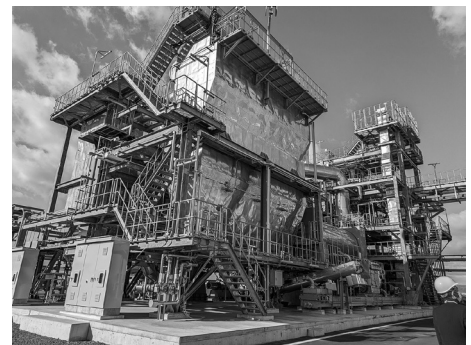
写真 固形燃料化プラント (松山市西部浄化センター)

今後も、産業廃棄物の適正処理や資源の循環利用に関する現状について、学会での発表等を通じて、広く関係者の皆さまに周知し、ご意見をいただきたいと考えております。