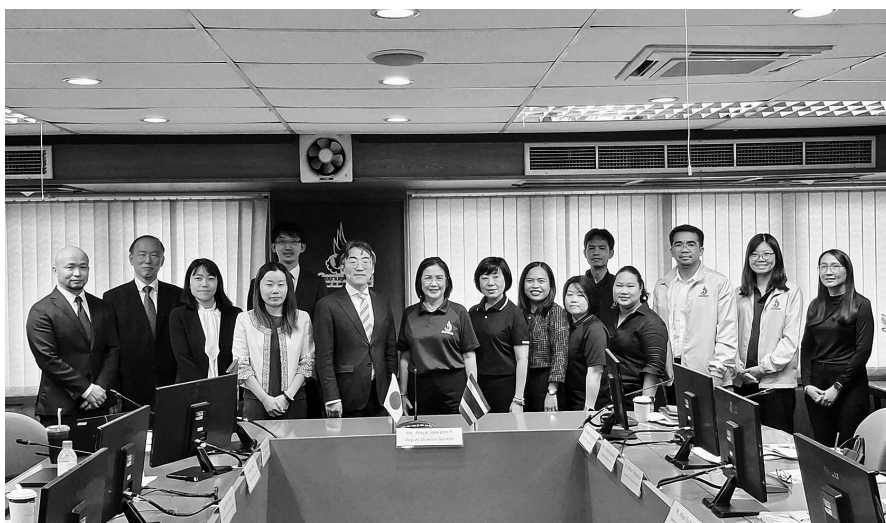
写真 タイ工業省工業局会議室にて記念撮影

JWセンターは、今回のような国際的な場を通じて海外の電子マニフェスト制度に関する情報を収集するとともに、日本で培われてきた電子マニフェスト制度の知見を発信し、国際社会への貢献を一層進めていきたいと考えています。