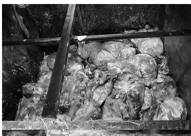
プラスチック袋の荷姿の食品廃棄物

家庭系・事業系の可燃ごみにはプラスチック製品や廃棄物を梱包しているビニール袋が含まれているため、可燃ごみを受け入れている施設では、破碎・選別装置を設置して、施設に受入後に生ごみと生ごみ以外の廃棄物を機械選別していた。家庭系の生ごみや事業系の食品廃棄物を単体で受け入れている施設の場合は、プラスチック製品やフォーク等の金属類が異物として混入している場合があるため、廃棄物中の異物を機械選別により取り除く取組みを実施していた。また、家庭系の生ごみを受け入れている自治体施設では、自治体が生ごみの分別収集を実施しており、家庭の段階で生ごみが分別排出されていた。写真1