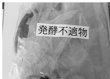
発酵不適物として回収されたプラスチック片