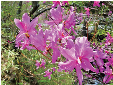
写真2 トウゴクミツバツツジ

※）表紙写真 写真提供：ピクスタ soranikumo / PIXTA（ピクスタ）