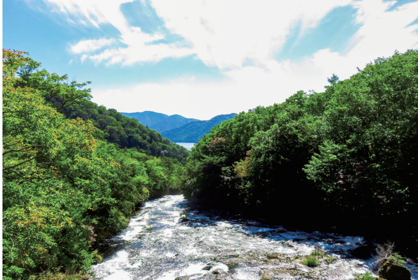
写真1 龍頭滝上流から見る中禅寺湖

龍頭滝（表紙写真 ※ ）は、栃木県日光市にある滝で、華厳滝、湯滝とあわせて「奥日光三名瀑」として知られる。湯ノ湖に端を発し、戦場ヶ原を流れ下ってきた湯川の末流にかかる。約1万5000年前の男体山の噴火によってできた溶岩の上を約210mにわたり幅10メートルほどの階段状の岩場を勢いよく流れる溪流瀑で、中禅寺湖に着する（写真1）。滝壺近くで大きな岩によって二分される様子を大きな岩が竜の頭、左右の滝の流れが竜の髭に見立てられこの名がついたといわれる。