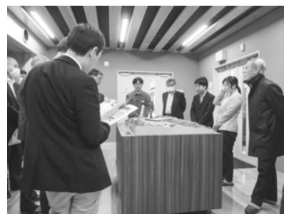
写真 1 施設見学の様子