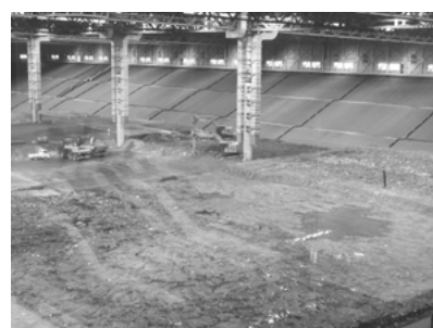
写真 2 被覆施設棟（埋立地）